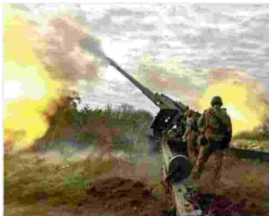
Una scena del film L'Ucraina che verrà di Jacopo Arbarello