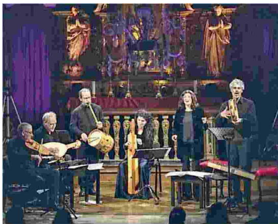
Domenica in Duomo a Pordenone il concerto Giullari di Dio