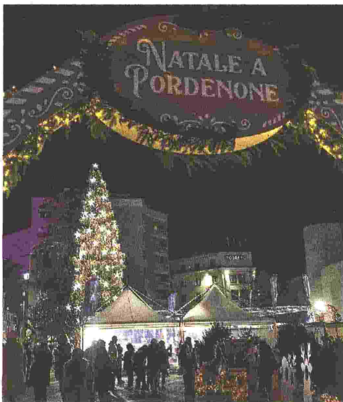
LA FESTA Nel villaggio centinaia di eventi

DAL VILLAGGIO NATALIZIO AL CHRISTMAS FESTIVAL, DALLA PISTA DI GHIACCIO AL TRENINO E A CAPODANNO IL CONCERTONE