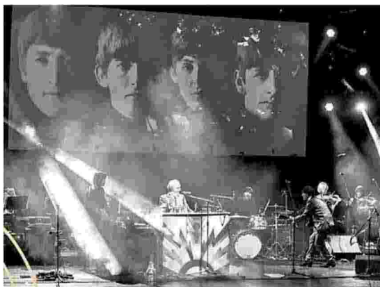
Appuntamento a Pordenone con il concerto "Magical Mystery"